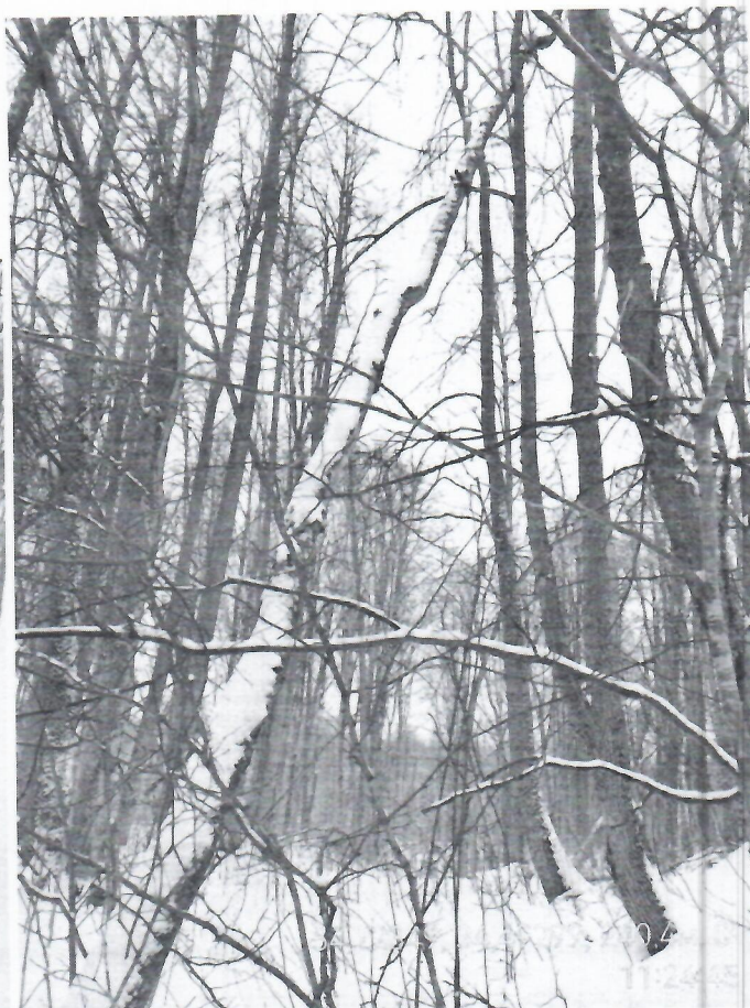
Номер дерева __6__